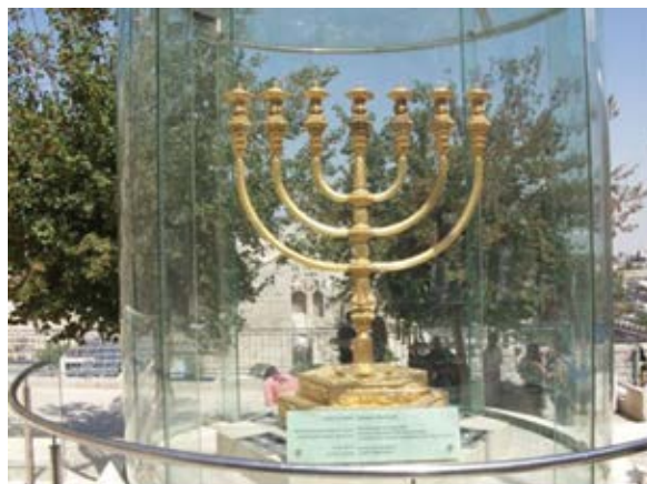
Model van die Menorah in Jerusalem

Die Kandelaar (Menora) (5) met sy sewe lampe is voortdurend aan die brand gehou deur die priesters.